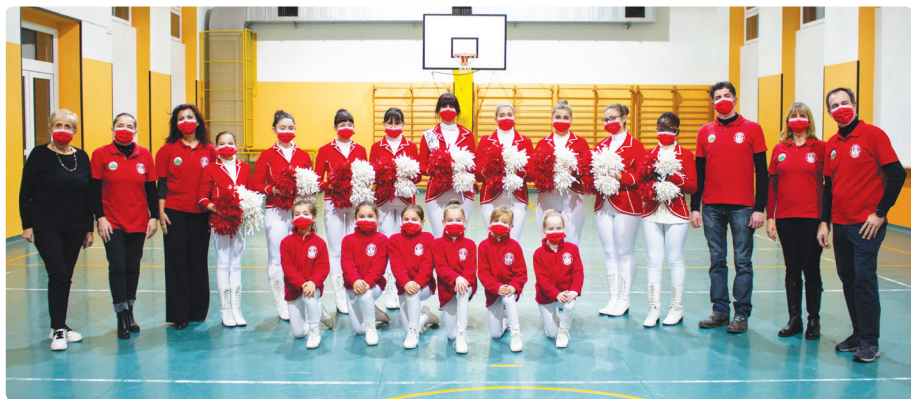
Tutto il gruppo Scarlet Stars

Solidarietà, onestà, impegno, determinazione e coraggio , sono l'eredità spirituale che ci ha permesso di affrontare le sfide inattese e di reagire in una situazione così fuori dall'ordinario. Mi è capitato spesso di chiedermi come i miei predecessori si sarebbero comportati in questa o quella occasione. Mi sento di poter dire che il nostro Gruppo, oggi, ha riferimenti valoriali più solidi che mai , particolarmente necessari in momenti di grandi cambiamenti come quelli che stiamo vivendo