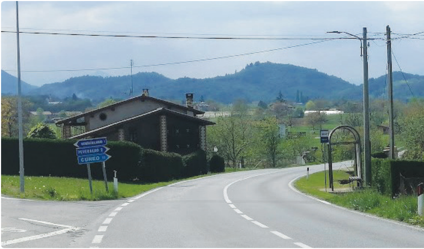
Prossimo attraversamento pedonale illuminato su Via Chiusa Pesio

A ggiornamento sull'avanzamento dei progetti: gli esecutivi sono pronti e si attende il nulla osta della Provincia per affidare i lavori di realizzazione dei passaggi pedonali illuminati su via Cuneo e via Chiusa Pesio.