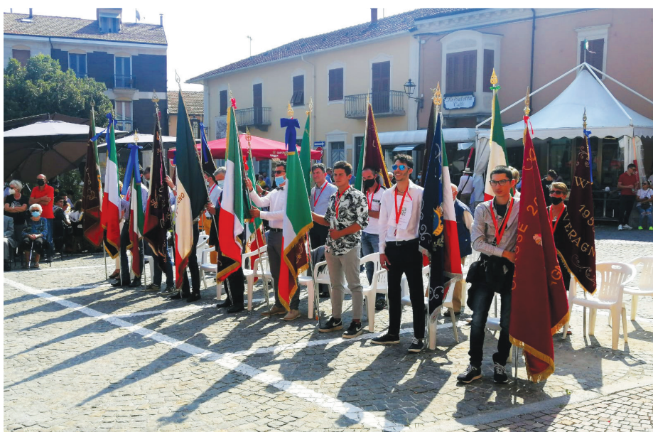
Festa delle Leve 5 settembre 2021

Una ripartenza che ha il sapore della gioia e suona come un paese in festa.