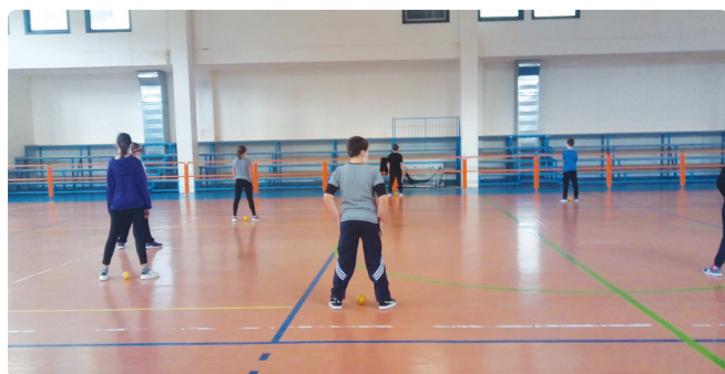
Gli alunni nelle palestre del Centro Sportivo Miclet

Nei mesi scorsi abbiamo utilizzato le palestre e il campetto del Centro Sportivo "Miclet" per eseguire diverse attività sportive.