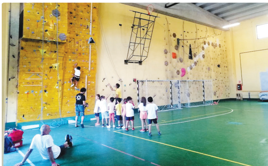
Prova di arrampicata durante l'evento "Conosciamo i nostri Sport" del 19 settembre 2021

Abbiamo dovuto fare i conti con una serie di impedimenti, tra questi l'impossibilità di utilizzare in maniera adeguata e conforme alla norma l'impianto di riscaldamento ad aria, dovendo così spostare,