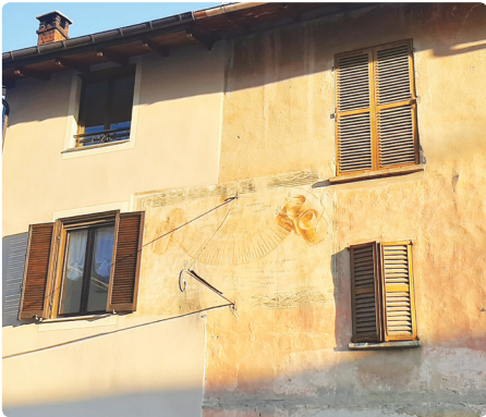
Meridiana in Via Vittorio Bersezio

Il 27 novembre 2021 abbiamo inaugurato il restauro del dipinto murale della SS. Trinità in Piazza XXX Martiri; con quest'incontro si è conclusa l'attività del 2021 ed abbiamo avuto modo di ringraziare coloro che hanno dimostrato interesse per l'iniziativa e che hanno a cuore il patrimonio storico ed artistico del paese.