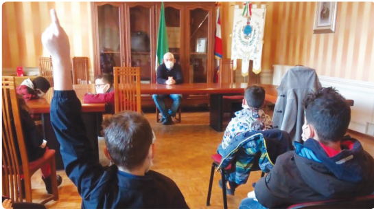
Incontro con gli alunni delle classi quinte della Scuola Primaria a dicembre 2021

Questo concetto, tanto elementare quanto ben conosciuto nel mondo rurale, vale in realtà anche se applicato a tanti aspetti della vita sociale della nostra comunità.