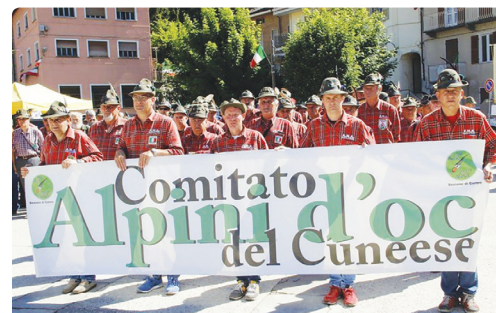
Sfilata Alpini D'OC del Cuneese

Il tutto condito con musiche, colori e spirito di aggregazione!