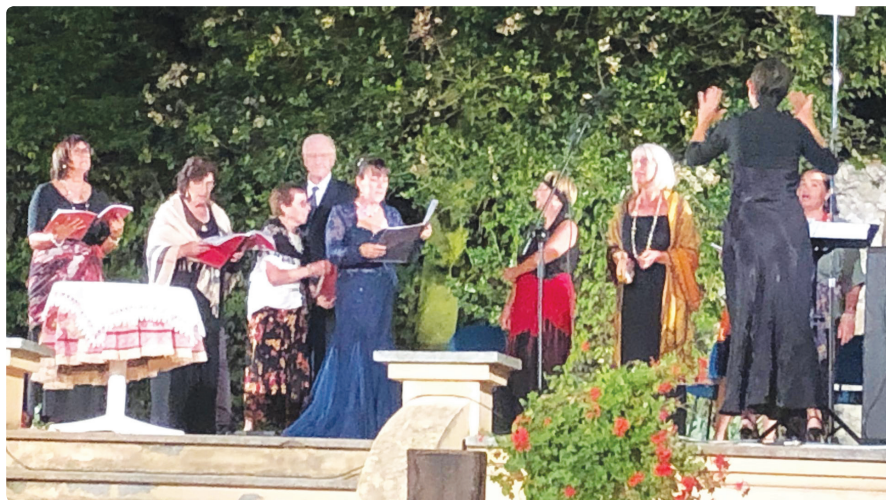
Coro Lirico di Centallo il 21 agosto 2021 nella cornice del cortile di Casa Ambrosino

A sancire il “nuovo inizio” gli incontri in presenza e le serate musicali e teatrali seguite da un folto pubblico, oltre al ritorno della Viasolada sui sentieri peveragnesi e al raduno dei motociclisti che sono tornati a far vibrare Piazza Toselli. La stessa piazza il 21 maggio (la chiusura del giornale è antecedente tale data) teatro