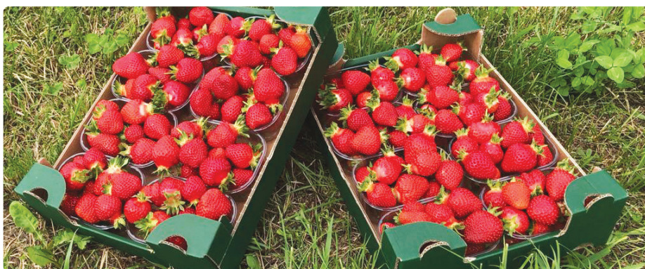
Fragole di Peveragno

Altra problematica importante riguarda la logistica: spesso alcuni prodotti, oltre ad avere visto un incremento di prezzo importante, risultano introvabili e non disponibili in seguito a blocchi della produzione o impossibilità logistiche nel trasporto e nella fornitura da altri paesi.