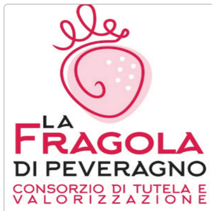
Logo Consorzio Fragola