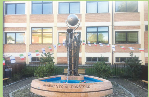
Monumento al donatore