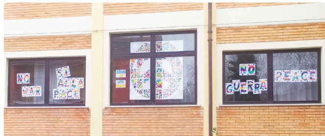
La "pace" alla finestra delle classi prime

Le classi prime della Scuola Primaria di Peveragno