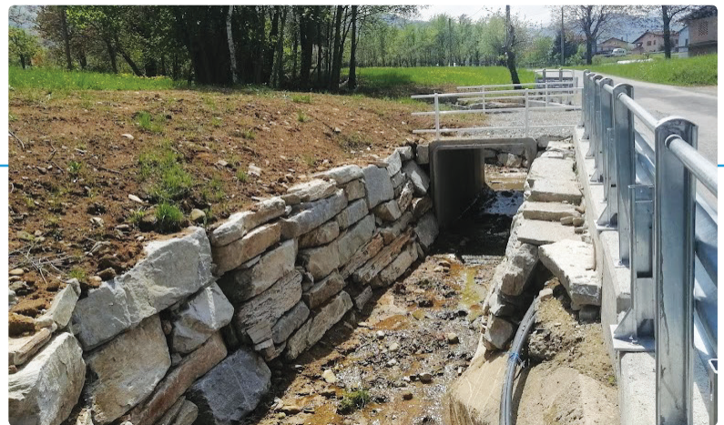
Ponte di Via Brard

U ltimati i lavori di risistemazione idraulica del rio Bealotas, nella zona del ponte di via Brard. Il torrente era stato intubato decenni fa, con sezioni di tubi non adeguate: è stato necessario rifare un intero tratto di alveo, mettendo la strada in sicurezza da esondazioni e cedimenti.