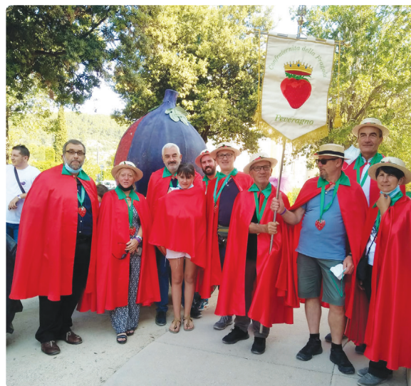
Il Comitato Gemellaggio a Solliès Pont ad agosto 2021

Seguirà il pranzo in piazza Trenta Martiri, dove i vari comitati peveragnesi prepareranno piatti street food.