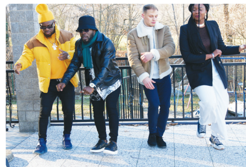
Immagine tratta dal Videoclip “Conquista”

Testi dei nuovi brani, invece, a cura di Costanza Rapa.