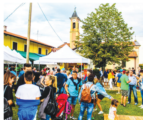
Un momento della festa delle passate edizioni

i migliori auguri di buon lavoro, ha provveduto al mantenimento e ristrutturazione dei locali della chiesa di Santa Margherita per favorire le occasioni di incontro e aggregazione della comunità della frazione.