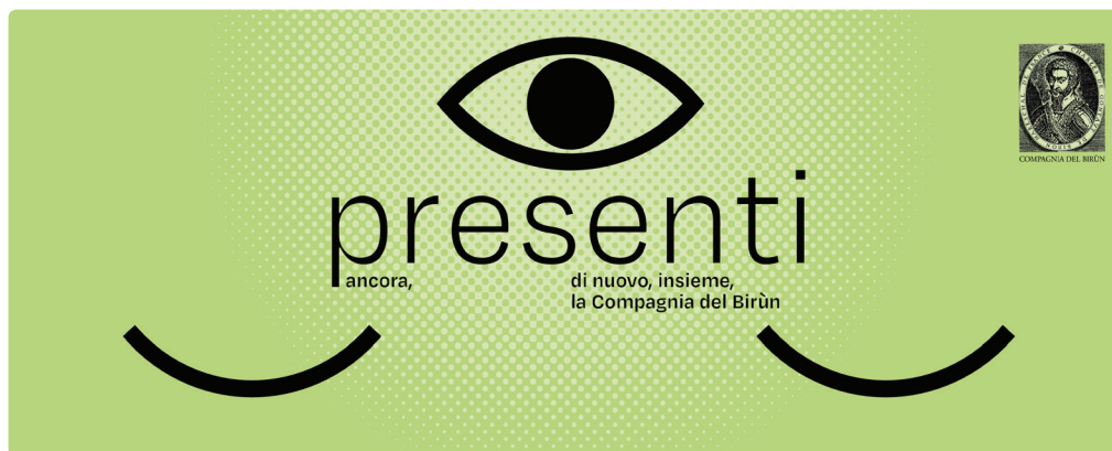
Logo della "Rassegna Assaggi 2022"

rappresenta la nuova consapevolezza del ridestarsi alla vita dopo l'isolamento forzato della pandemia: riaprire gli occhi al mondo aprendo per primo il terzo occhio, quello della coscienza, affinché la luce entri dove deve prima di tutto. Perché come ben sappiamo ormai, guardar fuori è in realtà guardare dentro sé stessi. E sembra che ce ne sia bisogno, oggi più che mai. Tutti gli appuntamenti saranno realizzati sul territorio di Peveragno: che possa essere un bell'esempio di rinascita, per tornare ad assaporare il tepore rinfrancante dell'incontro e del prendersi cura.