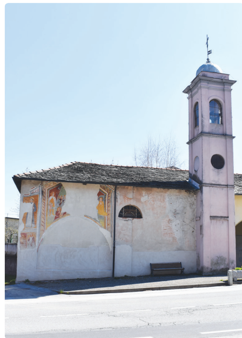
Affreschi sulla parete a nord-ovest della Cappella di San Rocco da Val

La cappella di San Rocco da Val sarà la prima parte del percorso sul territorio peveragnese: i presenti potranno visitare la chiesetta risalente al XIV-XV secolo (con particolare attenzione agli affreschi esterni risalenti al tardo 400) e, all'interno, il grande quadro raffigurante la Madonna con S. Rocco e S.