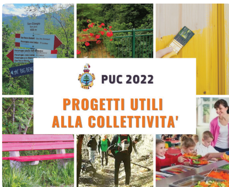
Locandina dei PUC

“Censimento cartellonistica sentieri” Manutenzione e nuove installazioni di cartelli per rendere i sentieri delle nostre colline più agibili ed utilizzabili.