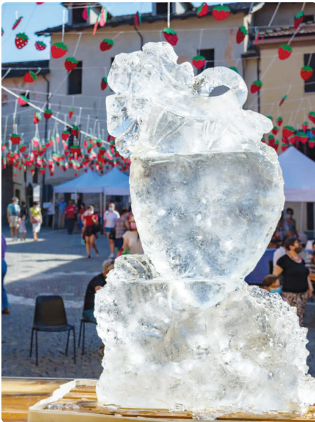
Un momento dell'edizione 2021 della Sagra della Fragola

R isolto, in parte, il problema del Covid, ci vediamo oggi a fronteggiare una situazione molto pesante che comporta un aumento dei costi delle attività a fronte di margini di utile sempre più sottili, non adeguati allo sforzo imprenditoriale delle nostre aziende.