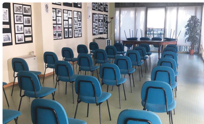
Sala Ambrosino ad oggi, prima dell'inizio dei lavori di ammodernamento

Entro il mese di luglio la Biblioteca Civica sarà dotata di nuovi arredi nelle aree di consultazione dei libri. Nella sala incontri principale (Sala Ambrosino) saranno installati, invece, un nuovo impianto audio video e un nuovo pc per migliorare l'esposizione di dati e immagini durante le conferenze e gli incontri. Il progetto di ammodernamento è stato possibile grazie ad un finanziamento (ottenuto con la partecipazione ad un bando della Regione Piemonte di cui si sono occupati gli assessori alla Cultura e alle Attività Produttive) che ha coperto gran parte delle spese.