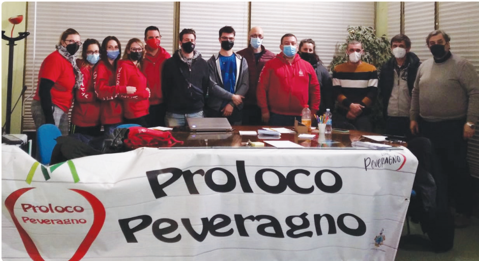
Il nuovo direttivo eletto