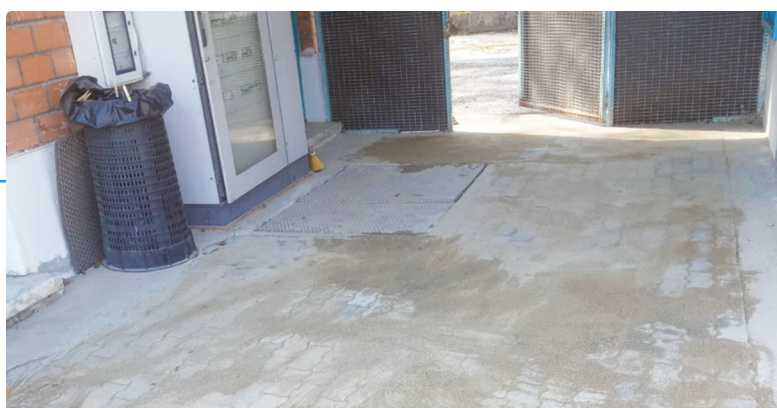
Nuova pavimentazione all'ingresso del campo da calcio grande

L'ingresso al campo da calcio grande e agli spogliatoi è stato risistemato con nuova pavimentazione ad autobloccanti; contemporaneamente, sono stati eseguiti interventi di riparazione perdite negli spogliatoi della pallapugno.