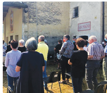
Tradizionale messa in onore di San Magno il 22 agosto 2021

Iscriviti al canale Telegram VisitPeveragno per essere aggiornato sui principali avvenimenti del tuo Comune!