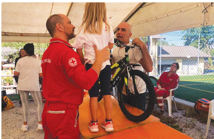
Un momento della premiazione di "Conosciamo i nostri Sport" del 19 settembre 2021

Stiamo lavorando sia per riprendere alcune "vecchie" proposte, che per introdurne nuove (anche a livello formativo, coinvolgendo alcune strutture del territorio) tra queste "Un'Estate Ragazzi in Polisportiva".