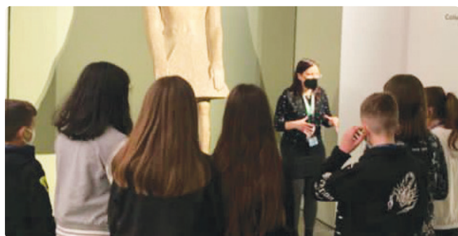
Alunni al Museo Egizio di Torino

Con la scuola abbiamo visitato il Museo Egizio di Torino, emozionati e desiderosi di arricchire il nostro bagaglio di conoscenze e di assaporare la storia, non solo quella letta e studiata. Ci siamo lasciati trasportare dalle parole della nostra guida in un mondo lontano, ma a noi noto e familiare. Abbiamo visto sfingi e statue maestose che ci hanno fatto sentire piccolissimi, e siamo tornati a casa orgogliosi e con un bagaglio di sapere più grande.