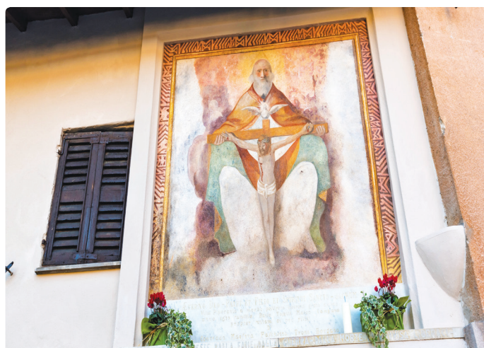
Dipinto murale della Santissima Trinità in piazza XXX Martiri