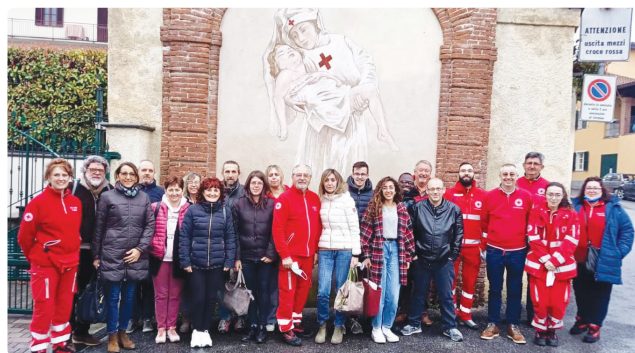
I volontari della Croce Rossa

Ci tengo altresì, a dare il benvenuto ai ventidue nuovi Volontari che stanno studiando e presto saranno operativi sul nostro territorio.