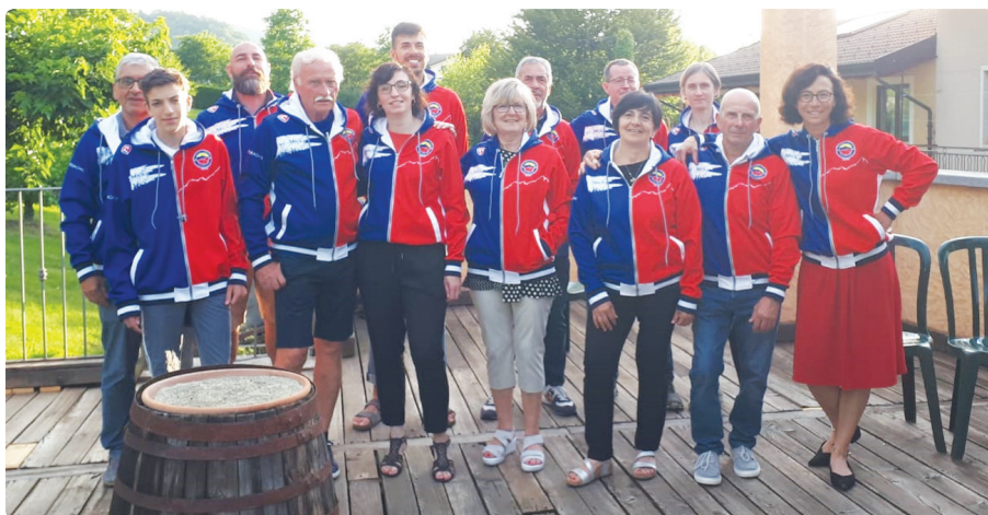
Il Gruppo Tennis Club Peveragno

N el mese di aprile il Tennis Club di Peveragno ha aperto nuovamente i battenti sui campi in terra rossa con la programmazione delle attività per la nuova stagione tennistica.