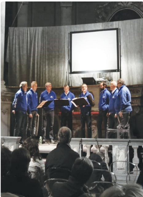
Maggio in Musica 2019

Dopo gli appuntamenti del "MAGGIO IN MUSICA 2022", ecco gli altri eventi dell'estate: