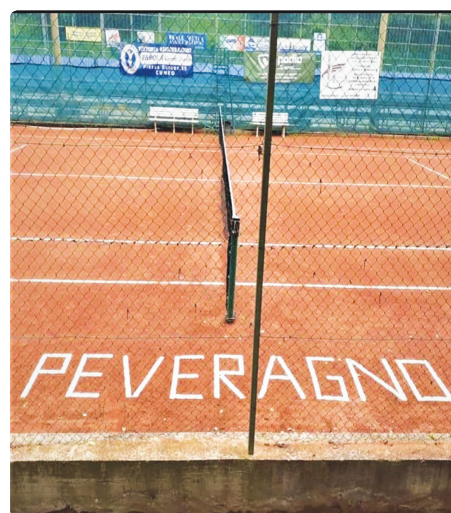
Campo da tennis di Regione Miclet

Il Direttivo del Tennis Club di Peveragno