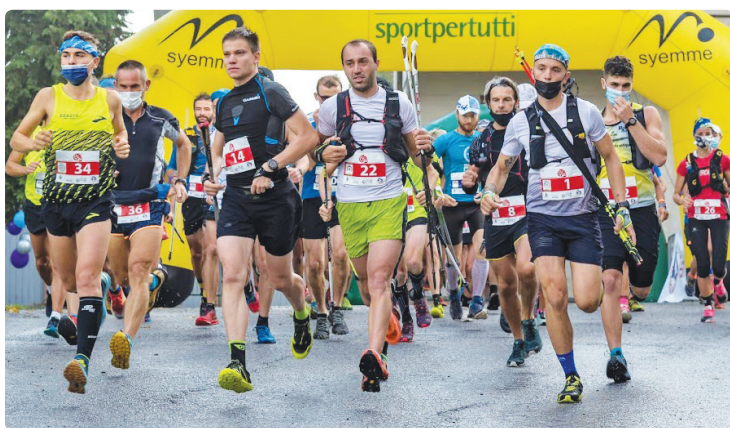
Partenza della prima edizione BisUp 26 settembre 2021

- A dicembre la "Messa di Natale" si svolgerà sempre all'esterno del Santuario della Madonna del Borgato alle ore sedici per lo scambio di auguri tra i frazionisti e tutti coloro che hanno Madonna dei Boschi nel cuore.