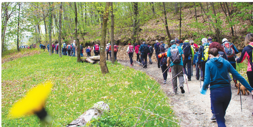
Viasolada 25 aprile 2022