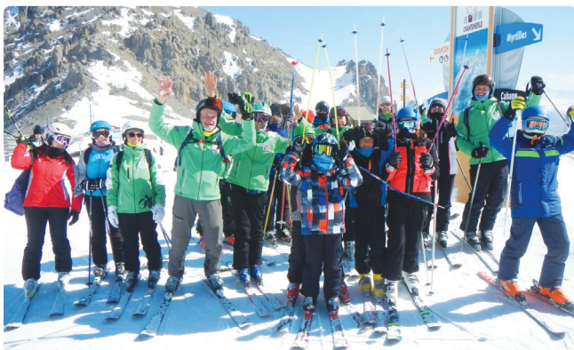
Un momento del corso di sci per bambini

A nche l'inverno 2021/22 è ormai finito e, nonostante la poca neve e la pandemia, siamo riusciti ad effettuare con successo le attività che avevamo programmato e siamo molto contenti dei risultati ottenuti.