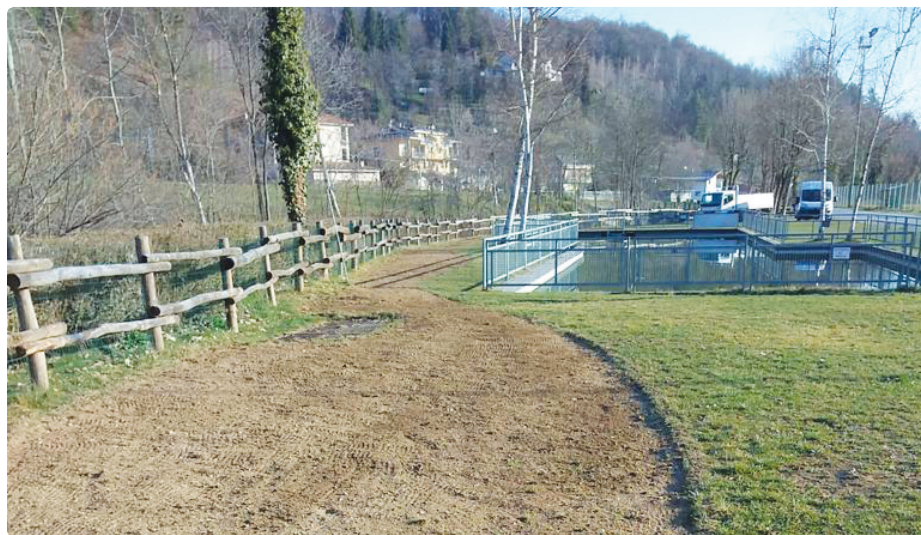
Preparazione dell'Oasi Fiorita in regione Miclet