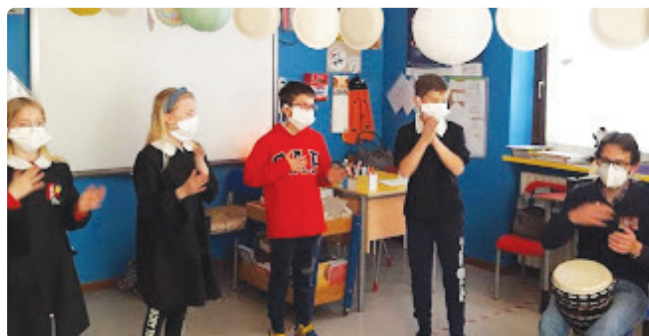
I bambini di San Lorenzo giocano con la musica